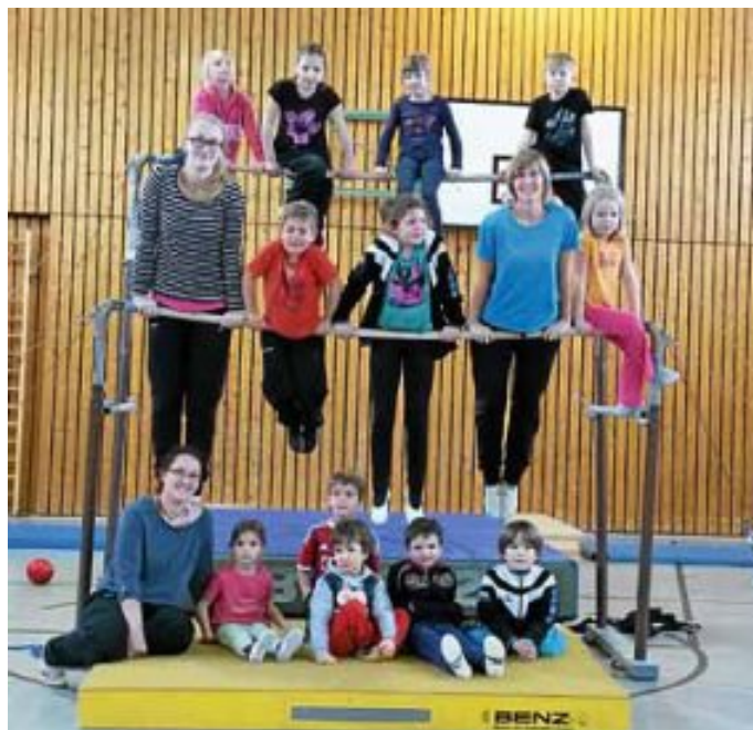
Die Turnminis und ihre Übungsleiter freuen sich auf das neue Turnjahr