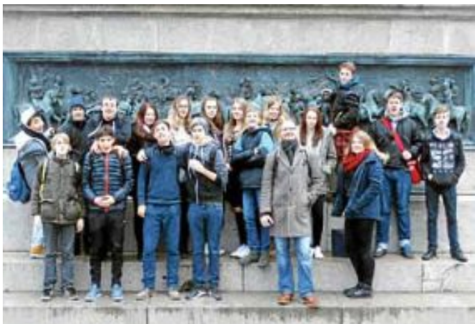
Die Klasse 9b vor dem Neuen Schloss