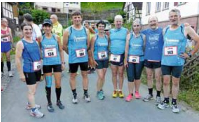
Unsere Teilnehmer beim Berglauf