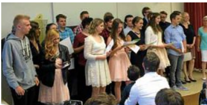
Die Zehntklässler verabschiedeten sich mit einem Lied.