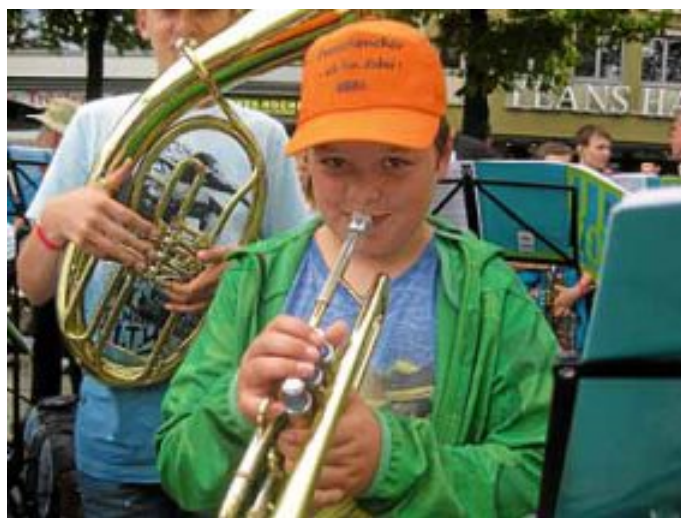
Unsere Jungbläser freuen sich nun über Ferien!

10.45 Uhr Campinggottesdienst in Liebelsberg