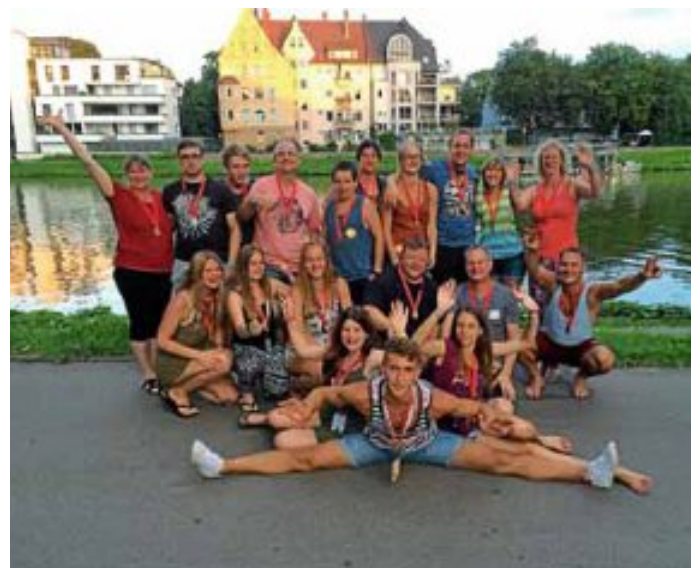
Alle Altburger Teilnehmer des diesjährigen Landesturnfestes