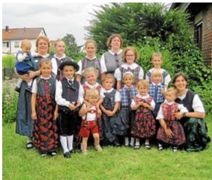
Auch unsere Jüngsten waren wieder mit dabei

ten - endlich da. Erholt Euch gut und viel Spaß in Euren Ferien. Wir treffen uns am Dienstag, 13.9. wie gewohnt wieder um 17 Uhr im Rathaus in Altburg.