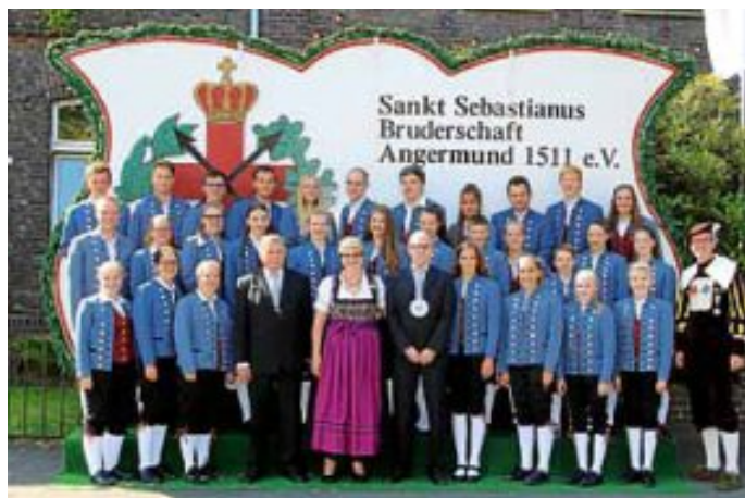
Ein gemeinsames Erinnerungsbild der Jugendkapelle mit dem Königspaar des Schützenfestes Angermund.

Schützen umrahmte. Abends fand der Fackelumzug statt, bei dem die Jugendkapelle mitmarschierte. Das Ende des Umzugs war der Zapfenstreich und ein großes Feuerwerk. Am Sonntag spielte die Jugendkapelle im Festzelt zum Fröhschoppen. Anschließend wurden dann auch schon wieder die Koffer gepackt und die Heimfahrt stand an. Die Jugendkapelle bedankte sich herzlich für die außer-gewöhnliche Gastfreundschaft der Angermunder und wird dieses Wochenende noch sehr lange in Erinnerung behalten.