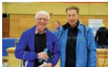
Horst bei der Siegerehrung

Er konnte seine Ausnahmestellung in der M80 wieder mal bestätigen und siegte souverän. Seine Zeit von 1:47:23 über die 20 km kann sich durchaus sehen lassen!