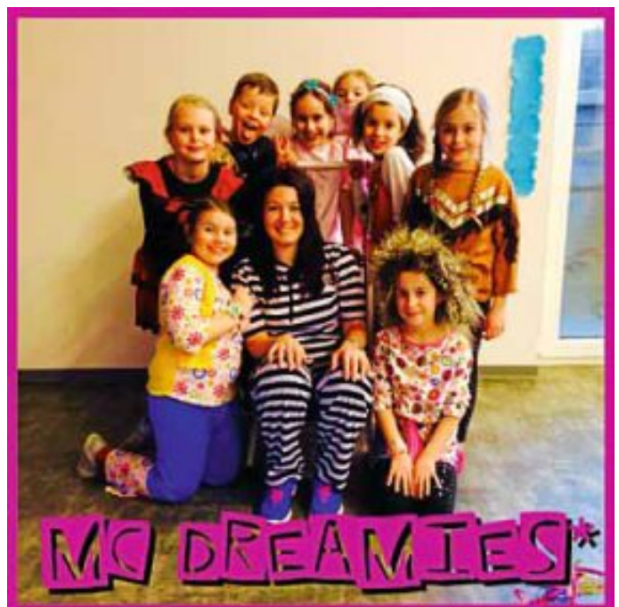
Fasching mit den Mc Dreamies*

Nicht mehr lange und sie dürfen dieses Jahr ihr Können das erste Mal bei der süddeutschen Meisterschaft in Freudenstadt unter Beweis stellen. Die Gruppe wird in der Kategorie „Mini-Kids“ starten und muss sich dabei gegen Tanzschulen behaupten. Damit sie dieses Ziel erreichen können, trainieren sie schon sehr fleißig, um ihre Show nach dem Motto „Mc Dreamies* fights for fun“ unter Beweis zu stellen.