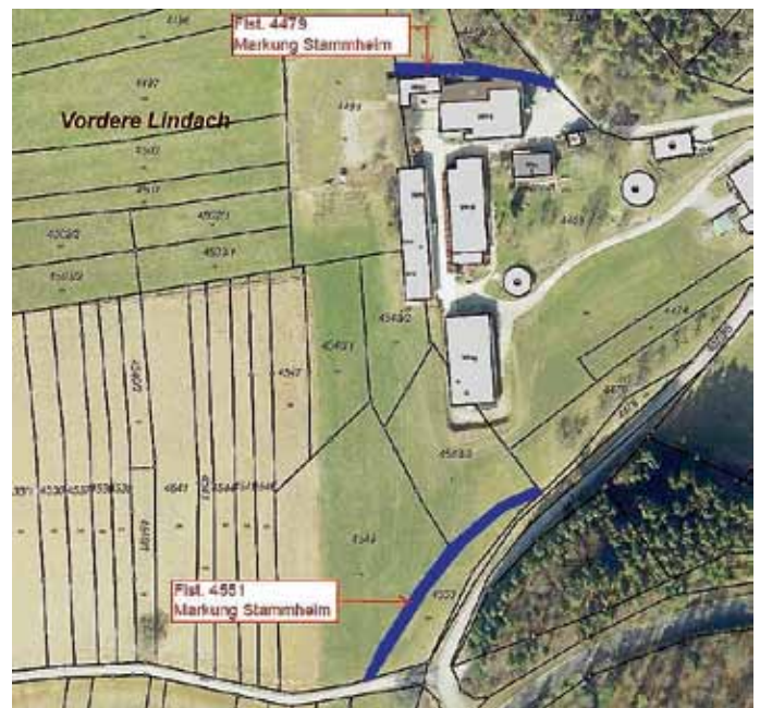
Feldwege Flst. 4479 und 4551, Gewann „Vordere Lindach“