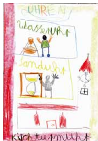
Einblick in das Epochenheft - Wie die Zeit sich messen lässt

Auf dem Lehrplan der 3. Klasse stehen im Rechenunterricht "Maß und Zahl". An der Waldorfschule gingen die Schüler und Schülerinnen ganz praktisch an und vermaßen zunächst alles, was mit ihnen selbst zu tun hat. Da wurden Schrittlängen und Ellen verglichen und jedes Kind zeichnete die eigenen Maße auf einen zurechtgesägten Stock auf. Wie viele Ellen ist die Tafel lang? Wer ist das größte Mädchen und wie viele Schrittlängen braucht es für den Schulflur? Es wurden Kinder, Tische und Flure vermessen und gezeichnet. Es wurden die verschiedenen Ergebnisse in Tabellen übertragen, verglichen und umgerechnet. Nach