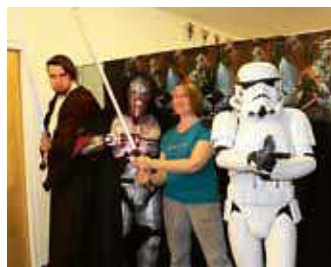
Star Wars Reads Day 2019