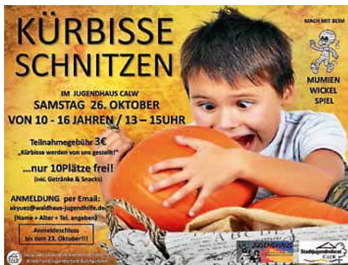
Plakat: André Weiß

Auch in diesem Jahr wird es mit Beginn der Herbstferien wieder eine Kürbisschnitzaktion im Calwer Jugendhaus geben. Am Samstag, 26. Oktober werden von 13:00 Uhr bis 15:00 Uhr Kürbisse