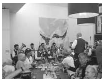
Oktoberfest mit der Stadtkapelle Calw

Am 18. Oktober war es endlich soweit – voller Vorfreude auf Weißwürste, Brezeln und Fassbier versammelten sich die Bewohnerinnen und Bewohner des Seniorenzentrum Torgasse im Café Bohne. Mit guter Tradition stand wieder der Auftritt der Stadtkapelle Calw unter der Leitung von Herrn Daub auf dem Programm.