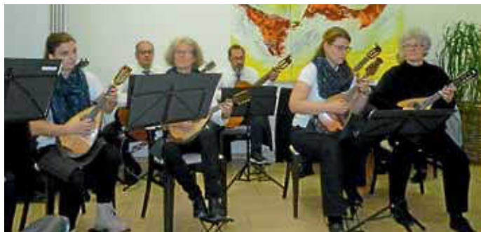
Mandolinenorchester Bad Wildbad

Zum wiederholten Male erfreute das „Mandolinenorchester des Musikvereins Bad Wildbad“ bei der monatlichen Veranstaltungsreihe im Seniorenzentrum Torgasse am 23. Oktober 2019 die rund 50 Besucher mit eingängigen, unterhaltsamen Melodien.