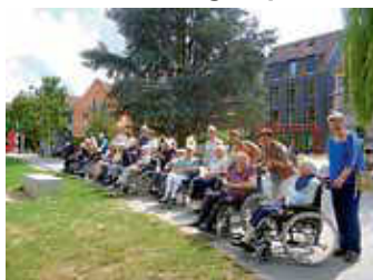
Spielplatz an der Nagold

In der vergangenen wärmeren Jahreszeit fanden im Seniorenzentrum Torgasse wie bereits seit vielen Jahren jeden Monat organisierte Gruppenspaziergänge für unsere Bewohnerinnen und Bewohner statt, die auf Begleitung und Unterstützung angewiesen sind. Die Route ist beständig: Das erste Ziel führt über den Spielplatz zur Nagold, wo wir die Enten beobachten und die quirlige Atmosphäre