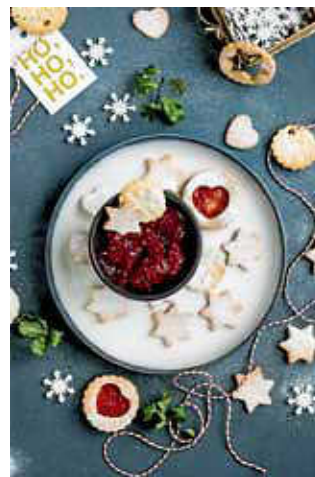
Hhhmmmmm, wie lecker! Selbstgebackene Plätzchen

Die Emil-Molt-Schule Freie Waldorfschule Calw e.V. lädt Sie herzlich ein, am Weihnachtsmarkt an ihrem Stand zu verweilen