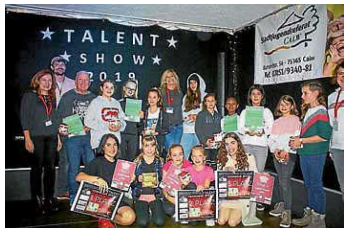
Teilnehmende Künstler und Jury