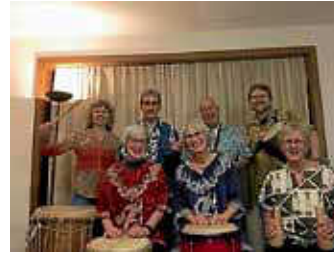
Trommelgruppe Mukinga

Am Mittwoch, 27.11.2019, gibt es bei der Veranstaltungsreihe „Kultur im Café Bohne“ einen besonderen Event. Die Trommelgruppe „Mukinga“ ist zu Gast und singt und trommelt unter der Leitung von Michael Siefke afrikanische und südafrikanische Musikstücke. Dabei werden verschiedene Trommeln, Gitarre, Perkussion und Körperinstrumente eingesetzt.