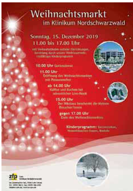
Plakat: Klinikum Nordschwarzwald