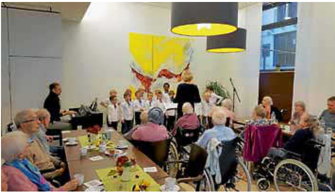
Vorchor Aurelius Sängerknaben Calw