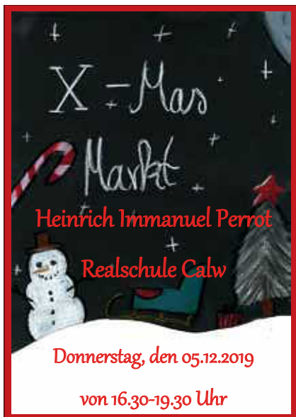
Plakar: HIP Realschule

Verkauft werden unterschiedliche Gerichte und Getränke sowie selbstgebastelte Weihnachtsdekorationen der Schülerinnen und Schüler.