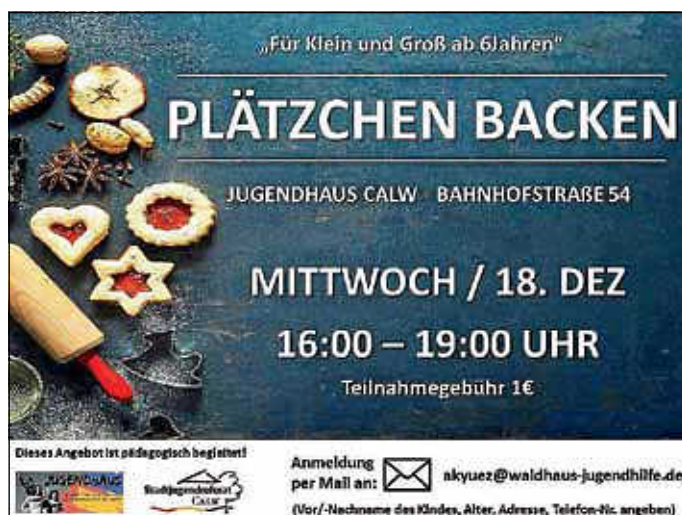
Plakat: André Weiß

Anmeldung erfolgt per E-Mail: akyuez@waldhaus-jugendhilfe.de . Bitte hierzu: Vor-/Nachname des Kindes, Alter sowie die Anschrift und eine erreichbare Telefon-Nummer des Elternteils mit angeben.