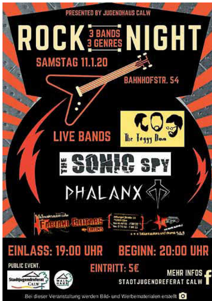
Plakat: André Weiß

Am Samstag, 11. Januar 2020, starten wir laut ins neue Jahr - im Calwer Jugendhaus wird es nach längerer Pause wieder ein Live-Konzert mit 3 Bands geben. Der Einlass an diesem Abend erfolgt um 19:00 Uhr, Beginn des Konzertes wird ca. 20:00 Uhr sein. Der Eintritt beträgt 5,- €. Folgende Bands unterschiedlichster Natur treten an diesem Abend auf: The Foggy Dawn, The Sonic Spy und PHALANX!