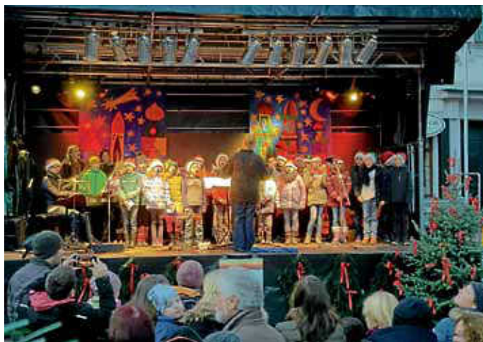
Singen auf der Bühne am Marktplatz

Wir danken allen Besuchern und Besucherinnen unseres Standes am Weihnachtsmarkt in Calw mit einem Text von Jutta Richter: