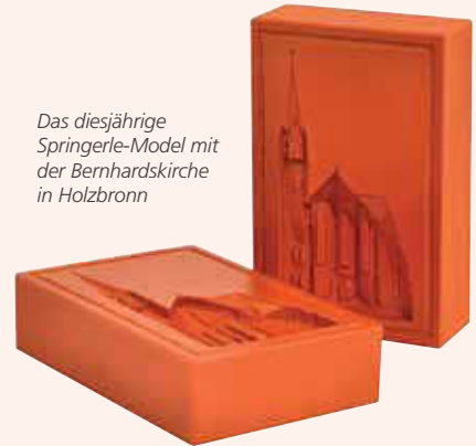
Das diesjährige Springerle-Model mit der Bernhardskirche in Holzbronn

Das Springerle Model ist (samt Springerle-Rezept) auf dem Weihnachtsmarkt vom 28. November bis 1. Dezember sowie in der Touristinformation (Marktplatz 7) für 6 Euro erhältlich.