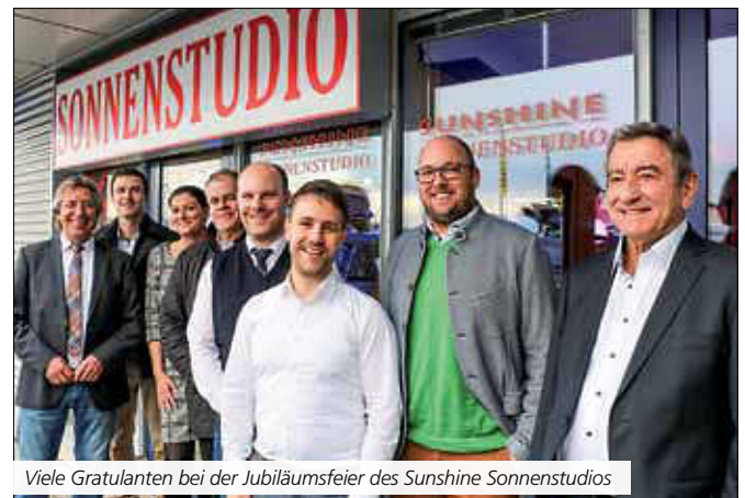
Viele Gratulanten bei der Jubiläumsfeier des Sunshine Sonnenstudios