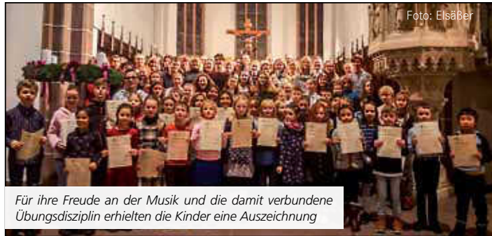
Für ihre Freude an der Musik und die damit verbundene Übungsdisziplin erhielten die Kinder eine Auszeichnung