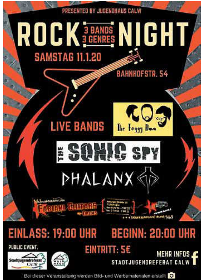
Plakat: André Weiß

Am Samstag, 11. Januar 2020, wird das neue Jahr im Calwer Jugendhaus mit lauten Klängen eingeläutet. Es erwarten euch 3 Livebands an diesem Abend - The Foggy Dawn, The Sonic Spy und PHALANX. Einlass ist um 19:00 Uhr, Beginn wird gegen 20:00 Uhr sein, der Eintritt beträgt 5,- €!