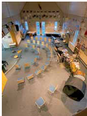
neue Bestuhlung