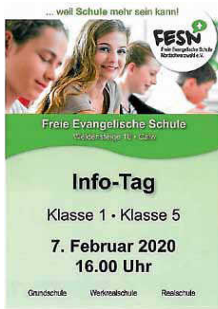
Plakat: S. L.