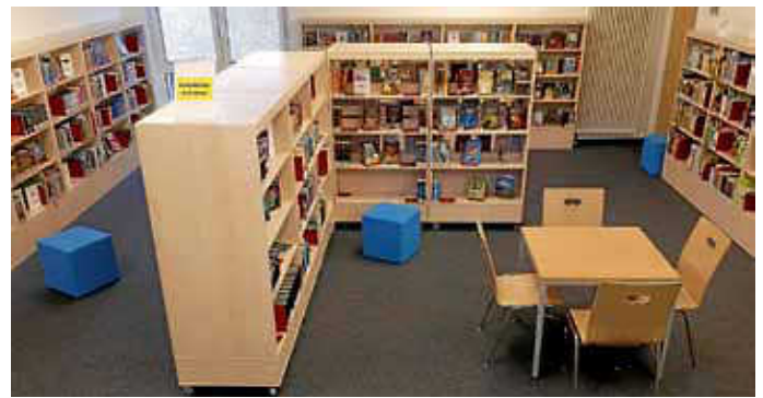
Kinderabteilung im UG