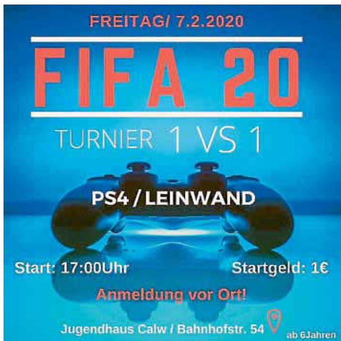
Plakat: André Weiß

Alle FIFA 20 begeisterten aufgepasst! Das Jugendhaus Calw veranstaltet am 7.2.20 ab 17:00 Uhr ein 1 vs. 1 FIFA 20 Turnier (PS4) auf großer Leinwand. Wer beim Turnier mitmachen möchte sollte mind. 6 Jahre alt sein und sich vor Ort im Calwer Jugendhaus (Bahnhofstr. 54) gegen eine Teilnehmergebühr in Höhe von 1,- € anmelden. Wir freuen uns auf euch!