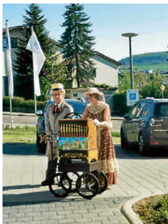
Drehorgelduo aus Rennigen

Danke im Namen der Bewohner der Seniorenresidenz Heumaden.