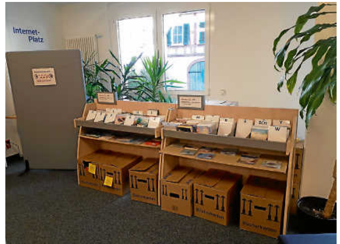
Abgesperrter Internetplatz & Kartonalager

Während der Öffnungszeiten haben nur Personen mit einer Mund- und Nasenmaske Zutritt, einzige Ausnahmen sind hier Säuglinge und Kleinkinder im Kinderwagen oder einer Trage. Da die Zahl der Besucher begrenzt ist, sind Wartezeiten einzurechnen. Alle, die von der Maskenpflicht befreit sind, haben die Möglichkeit, außerhalb der Öffnungszeiten einen Termin zu vereinbaren.