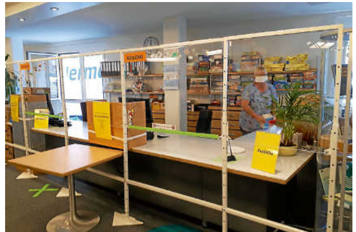
Verbuchungstheke mit Spuckschutz

Aus organisatorischen Gründen ist eine Anmeldung über die vhs Calw erforderlich: Tel.: 07051 9365-0 | mail@vhs-calw.de | www.vhs-calw.de