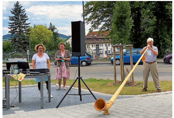
Draußenkonzert am 14.7.20

Danke im Namen der Bewohner der Sonnenresidenz Heumaden.