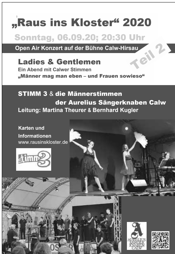
Aurelius im Kloster Hirsau