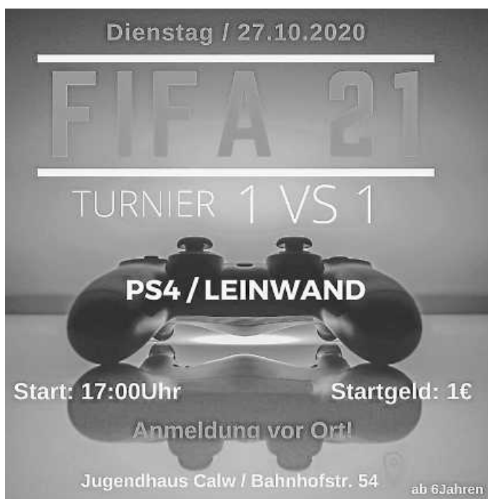
Plakat: André Weiß

Alle FIFA 21 begeisterten aufgepasst, es ist wieder soweit!!! Das Jugendhaus Team veranstaltet in diesem Jahr erneut ein 1 vs. 1 FIFA 21 Turnier (PS4) auf großer Leinwand im Jugendhaus Calw (Bahnhofstr. 54). Am Dienstag, 27. Oktober um 17:00 Uhr erfolgt der Startschuss mit den ersten Duellen. Wer beim Turnier mitmachen möchte, sollte ein Mindestalter von 6 Jahren haben. Anmeldungen sind vor Ort im Jugendhaus Calw gegen eine Teilnehmergebühr von 1,- € möglich.