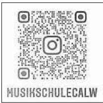
QR-Code: Musikschule Calw

Ob Holzblasinstrumente wie Blockflöte, Querflöte, Klarinette, Oboe, Fagott und Saxophon oder die Blechblasinstrumente Trompete, Horn, Posaune, Euphonium oder Tuba, die Auswahl ist groß.