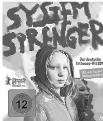
DVD: Weydemann Bros. GmbH