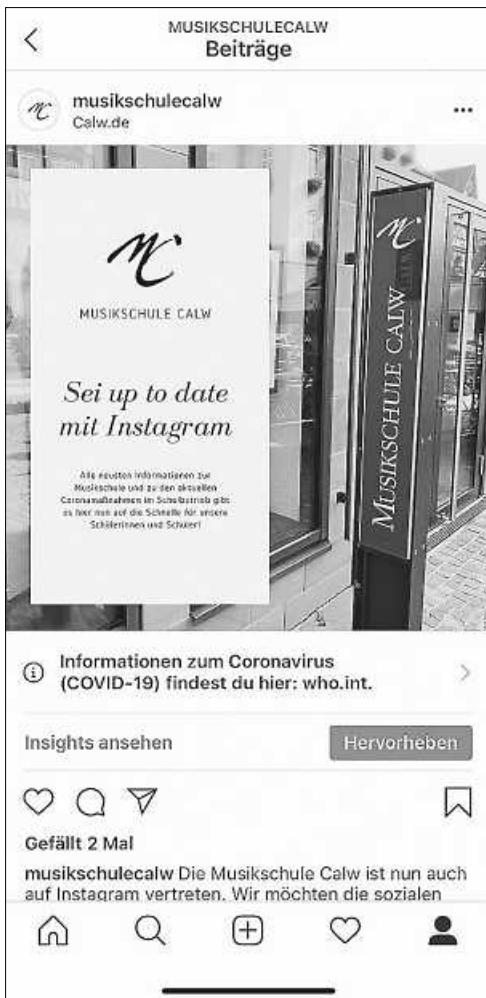
Plakat: Musikschule Calw

Wir haben wieder einige neue DVDs im Angebot, darunter auch den Abräumer beim Deutschen Filmpreis Systemsprenger . Auch Filme für Kinder sind mit dabei - wie beispielsweise Trolls World Tour oder Wunschtraumbaum . Bereits seit März haben wir übrigens nur noch eine einheitliche Ausleihfrist von 4 Wochen für alle Medien, so dass Sie für DVD-Rückgaben nicht mehr extra früher in die Stadtbibliothek kommen müssen!