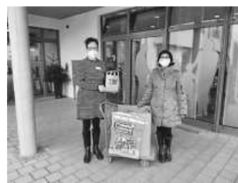
Mitmachen Ehrensache

Bei "Mitmachen Ehrensache" suchen Jugendliche für den Internationalen Tag des Ehrenamts, 5. Dezember, einen Job bei einem Arbeitgeber ihrer Wahl. Ehrenamtlich für ein gemeinschaftliches Projekt zu arbeiten, fördert die Identifikation der Jugendlichen mit ihrer Kommune bzw. ihrer Region und zeigt ihnen, dass man durch ehrenamtliches Engagement eine ganze Menge bewegen kann." So begrüßt Schirmherr Landrat Helmut Riegger die landesweite Aktion, die im Jahr 2019 erstmalig auch im Landkreis Calw stattfand.