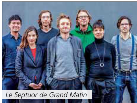
Le Septuor de Grand Matin