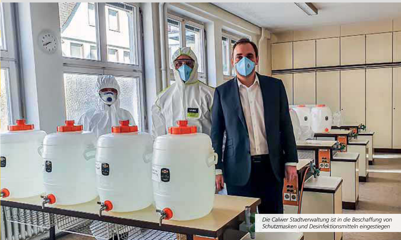
Die Calwer Stadtverwaltung ist in die Beschaffung von Schutzmasken und Desinfektionsmitteln eingestiegen