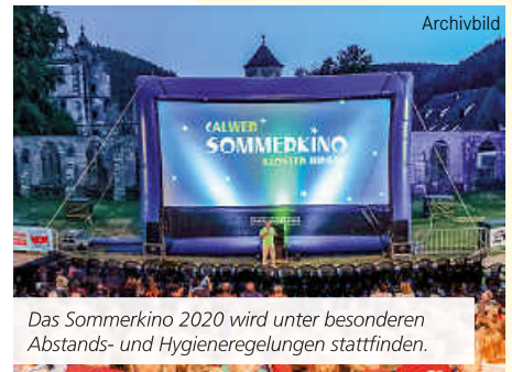
Das Sommerkino 2020 wird unter besonderen Abstands- und Hygieneregulungen stattfinden.