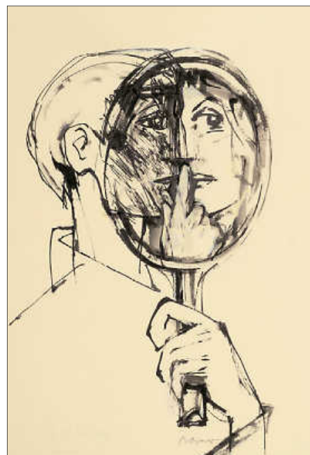
Illustration von Gunter Böhmer zu Hermann Hesses Steppenwolf, Gunter Böhmer-Stiftung (Dauerleihgabe des Landes Baden-Württemberg).

Seit vergangenem Dienstag ist die Ausstellung nun unter https://ausstellungen.deutsche-digitale-bibliothek.de/steppenwolf/ abrufbar. „Die Ausstellung selbst ist in drei Themenblöcke geglie-