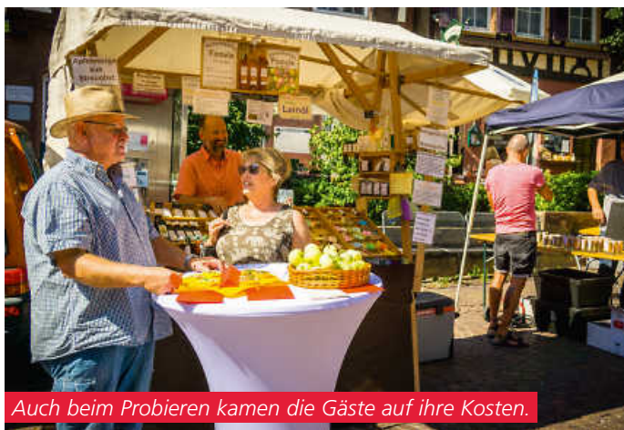
Auch beim Probieren kamen die Gäste auf ihre Kosten.