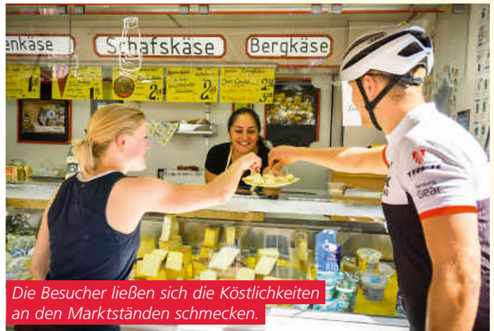
Die Besucher lieben sich die Köstlichkeiten an den Marktständen schmecken.