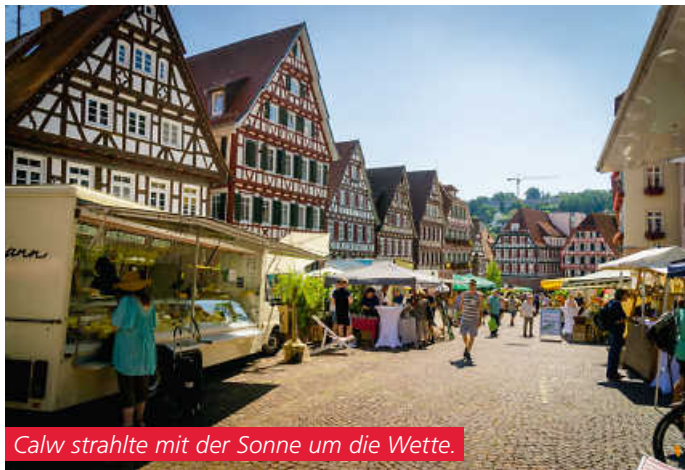
Calw strahlte mit der Sonne um die Wette.