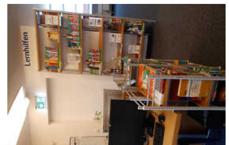
Die Lernbibliothek der Stadtbibliothek Calw

Adolf Timm Erläuterungen zur konkreten praktischen Umsetzung. Er benennt neun Kernkompetenzen für den Schulerfolg, wie unter anderem Neugier, positives Selbstbild, Resilienz, emotionale Intelligenz etc. Der Ratgeber ist übersichtlich gestaltet, anschaulich und gut lesbar und richtet sich an Eltern mit Kindern im Vorschulalter.